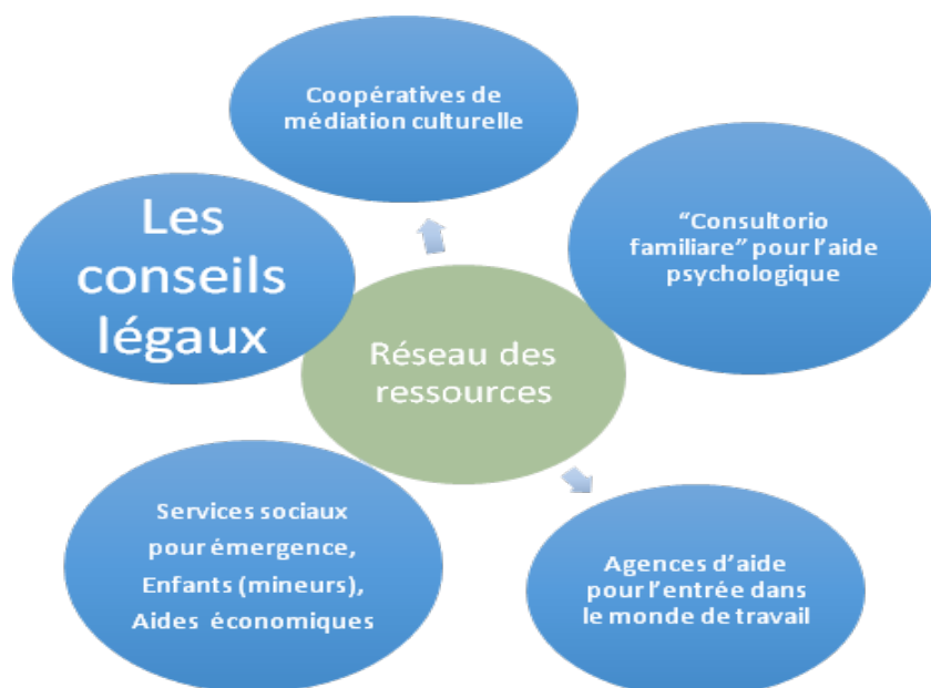
Fig. 2 - Le réseau des ressources